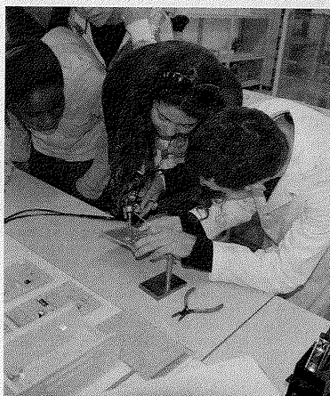
PREPARAÇÃO - Objectivo da ATEC.